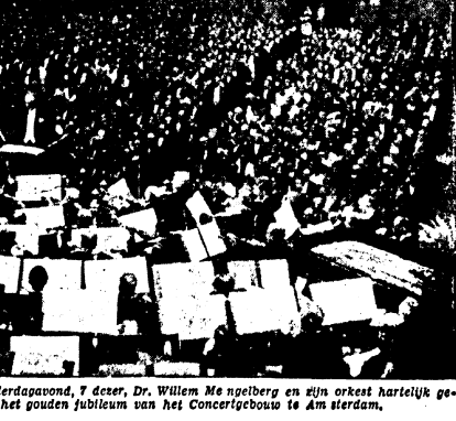
Een eestdriftig publiek heeft Donderdapaavond, 7 dezer, Dr. Willem Me ngeberg en zijn orkest hartelijk gehuldigd ter eere van het gouden jubileum van het Concertgebouw te Am sterdam.