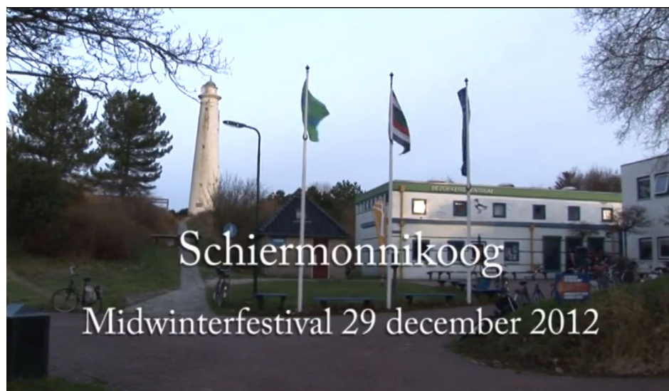
Laatste film van 2023: Midwinterfestival 2012